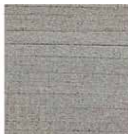
(D) Precompuesto ceniza