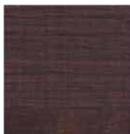
(T) Roble tabaco